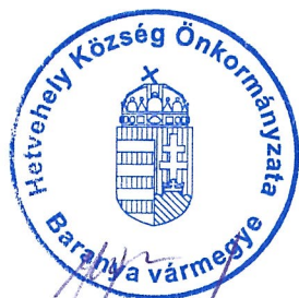
Wágner Antal polgármester

Más kérdés, hozzászólás, napirendi pont nem lévén, a polgármester megköszönte a megjelenést és az ülést 7.25 perckor bezárta.