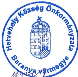
Wágner Antal polgármester

Más kérdés, hozzászólás, napirendi pont nem lévén, a polgármester megköszönte a megjelenést és az ülést 8.25 perckor bezárta.