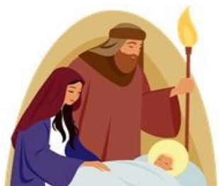
Wesofych Świąt Bożego Narodzenia

Magyarországon a katolikus keresztények számára Jézus születésnapjának fénypontja a karácsonyi misén való részvétel ( 24-én éjjélkor vagy 25-én napközben ). A református keresztények szentestén, azaz 24-én istentiszteleten vesznek részt, majd másnap úrvacsorát